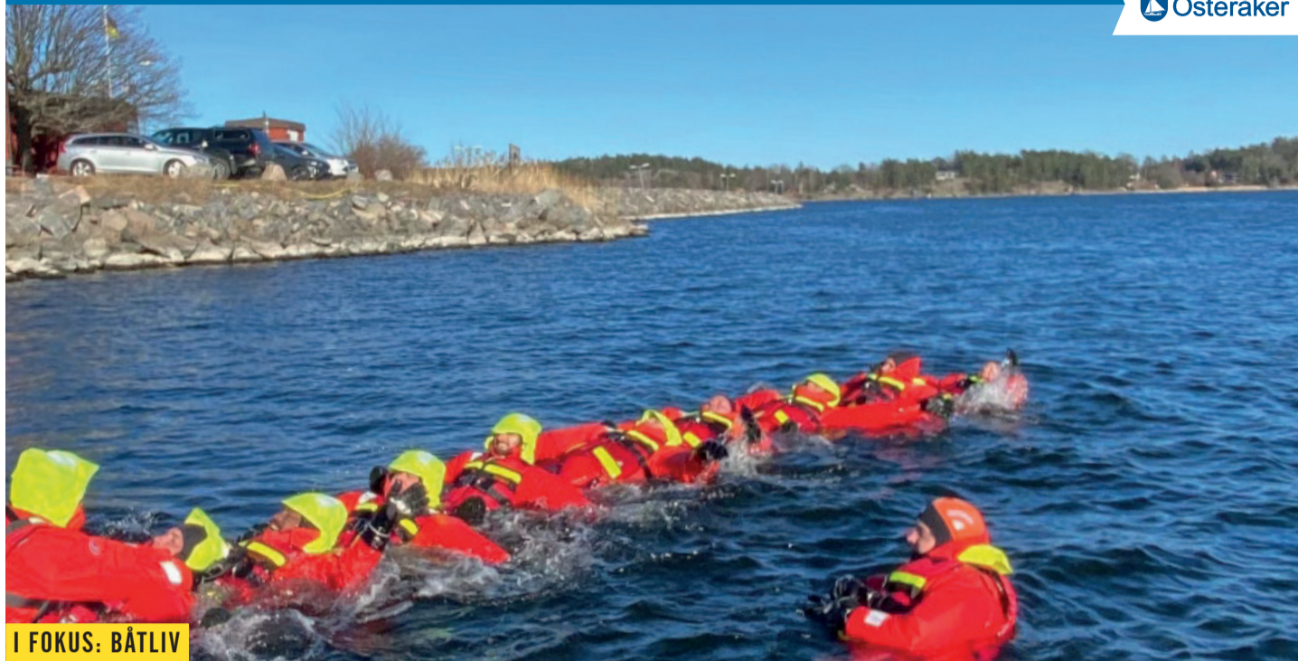
I FOKUS: BÅTLIV